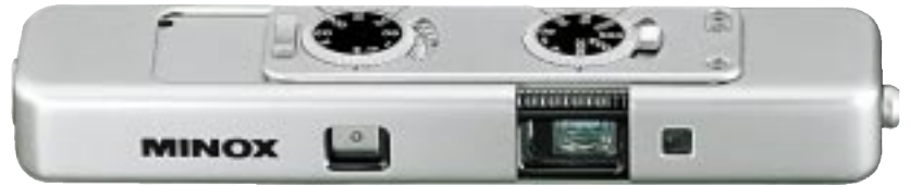
MINOX TLX (1:1)