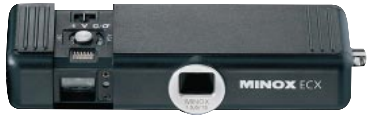
MINOX ECX (1:1)