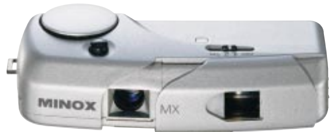
MINOX MX (1:1)