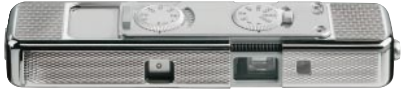
MINOX CLX (1:1)