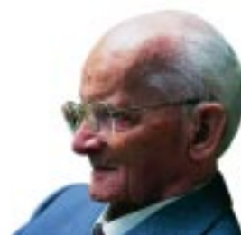
Dr. h.c. Walter Zapp, l'inventeur de l'appareil de format miniature MINOX, né le 4 Septembre 1905 à Riga (Lettonie)