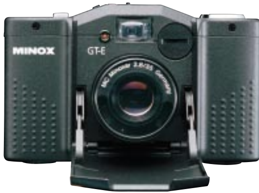
MINOX GT-E (new)