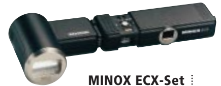
MINOX ECX-Set ..... avec flash, piles et film numéro de code 60525